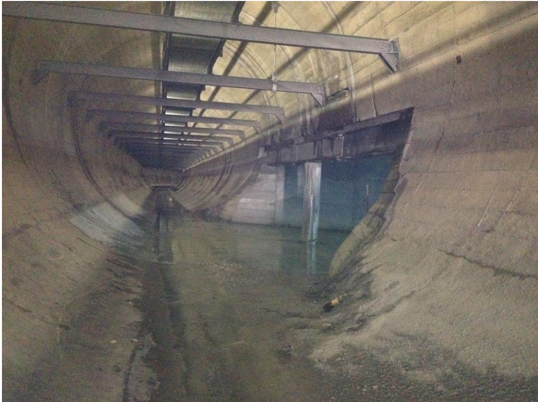
Apertura laterale della galleria esistente Enel

SOCIETA' OLTREPIAVE ENERGIE SRL Corso Buenos Aires 64/C 20124 Milano (MI) P.Iva 03746430168 Tel. 0364 75094 Fax 0364 75150 oltrepiaive.energie@gmail.com pec: oltrepiaive.energie@legalmail.it