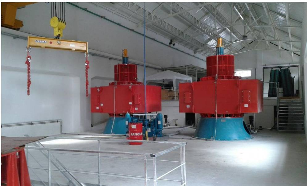
I due gruppi di produzione

Il canale di derivazione convoglia le acque in una vasca di carico dopo la quale sono installate due turbine Kaplan ad asse verticale con connessi direttamente n° 2 generatori sincroni della potenza di 950 kVA.